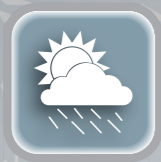
Resistente a Intempéries