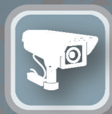
Vídeo Monitoramento 360°