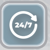
Operação 24 horas

Equipamentos utilizado como ponto de monitoramento e apoio, transformando a área monitorada em um ambiente seguro. Ideal para ser instalado em locais com grande circulação de pessoas, como parques, praças, vias, entorno de escolas, entre outros. O AutoGuardian, trata-se de um equipamento de segurança que agrega benefícios através de vídeo monitoramento e detecção automática de eventos.