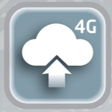
Conexão com Central