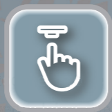
Botão de Emergência